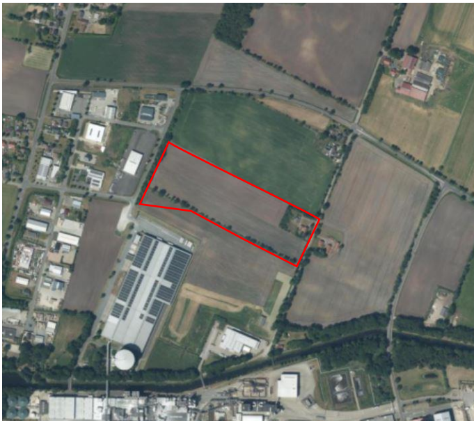
Abbildung 2: Lage des Planungsraums (unmaßstäblich)